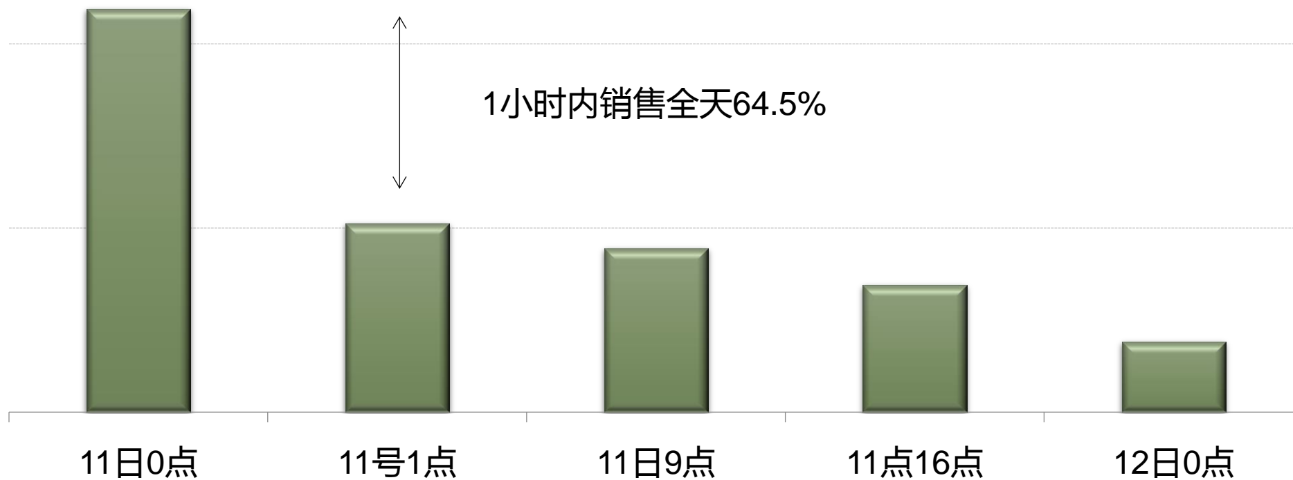
天猫彩电库存走势（万台）