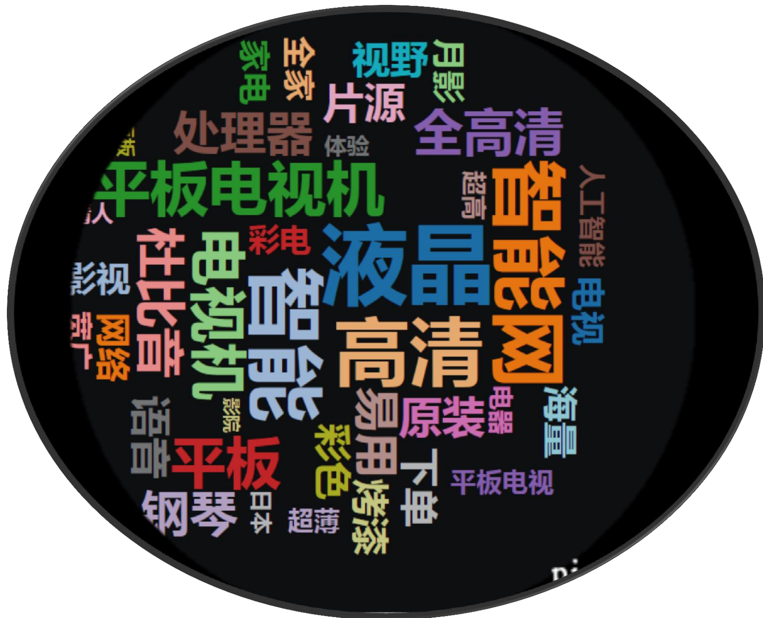
双十一热销产品热词云图